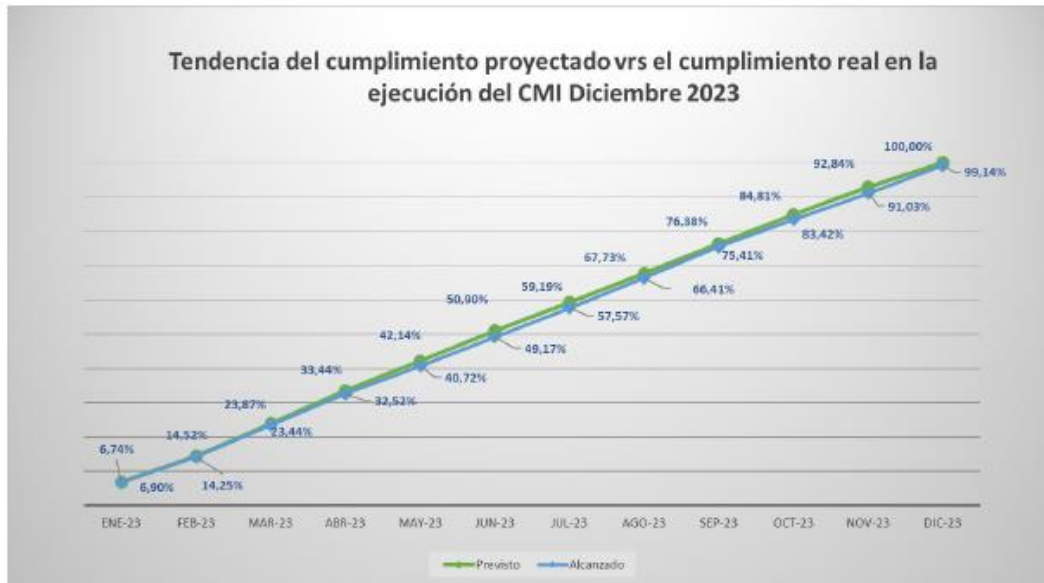
Gráfico 1: Tendencia del cumplimiento proyectado vs el cumplimiento real en la ejecución del plan físico a diciembre 2023